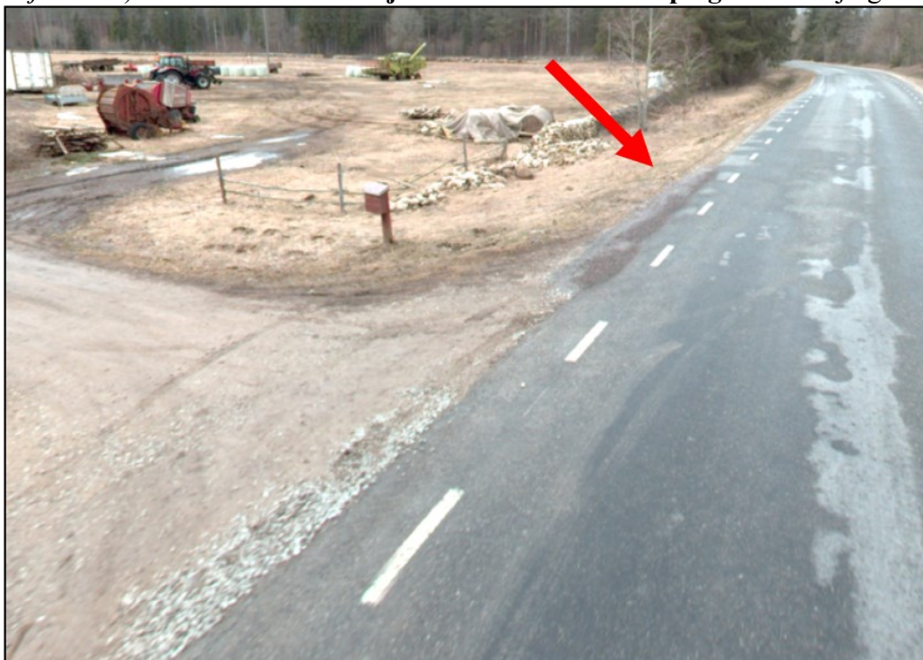
Joonis 3. Riigitee nr 11247 km 12,388 paremal väljavõtte teevideost (märts 2024)

Tuginedes liiklusseaduse § 7 1 lg 2 alusel kehtestatud majandus- ja taristuministri 09.07.2015 määruse nr 89 „Tähistatavate teede liigid, juhatus- ja teeninduskohamärkide paigaldamise kord ning sihtpunktidele viitamise süsteem“ § 2 ja 9 sätetele ning esitatud taotlusele kooskõlastame bussipeatuste asukohad riigitee km 12,388 (paremal, vt joonis 3 ), riigitee km 12,418 (vasakul, vt joonis 4 ) ootealade ehitamise ja liiklusmärkide 541a paigaldamise järgmistel tingimustel.