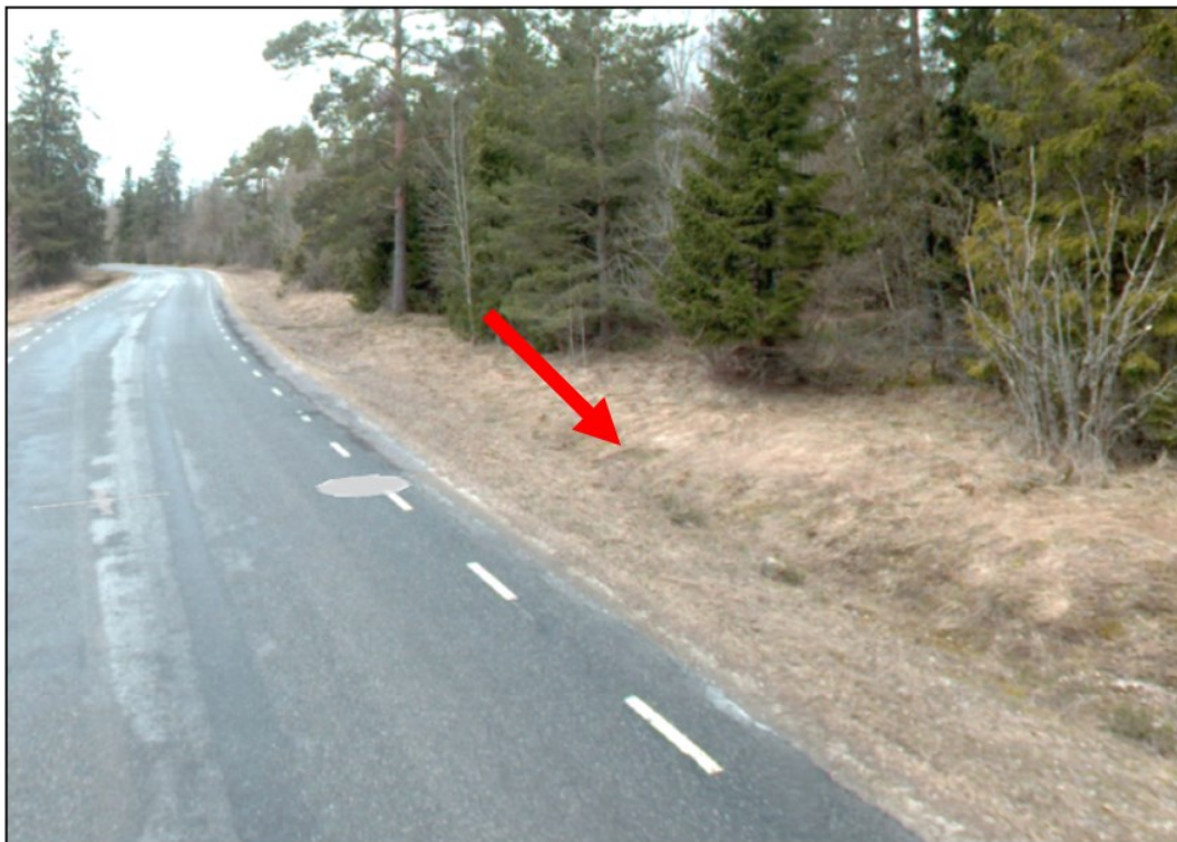
Joonis 4. Riigitee nr 11247 km 12,418 vasakul väljavõtte teevideost (märts 2024)